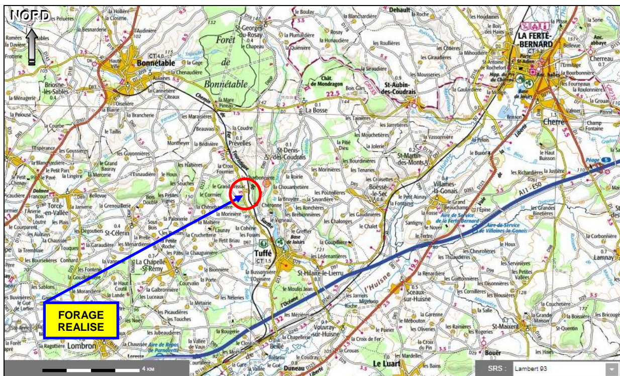
Situation du forage réalisé pour le besoin en eau des cultures du G.A.E.C. BOURNEUF à LA CHARBONNIERE (TUFFE - VAL-DE-LA-CHERONNE - 72) sur un extrait de carte topographique de l'IGN à 1/100 000°